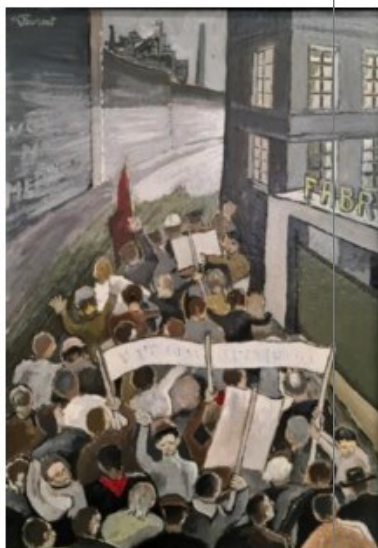
« La manif », Émile Laurent (1920). Estimation 200-300 €. »

C'est que le collectionneur prenait soin de ses trésors. 10 % d'entre eux garnissaient la maison ; les autres, stockés dans des locaux professionnels, Valéry Soudant a passé cinq après-midis à les inventorier et à les débiter un à un. En s'émerveillant comme si c'était son anniversaire.