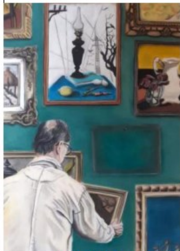
« Le docteur R.G. contemplant sa collection », Mathys Delattre (2000). A l'avant plan, un rare Marcel Delmotte côtoyant un Léon Devos du groupe Nervia. Estimation 200-300 €. »

C'est sans aucun doute ce que pense le docteur R.G., dont l'immense collection de tableaux belges sera dispersée par la maison MJV Soudant à Gerpinnes fin février.